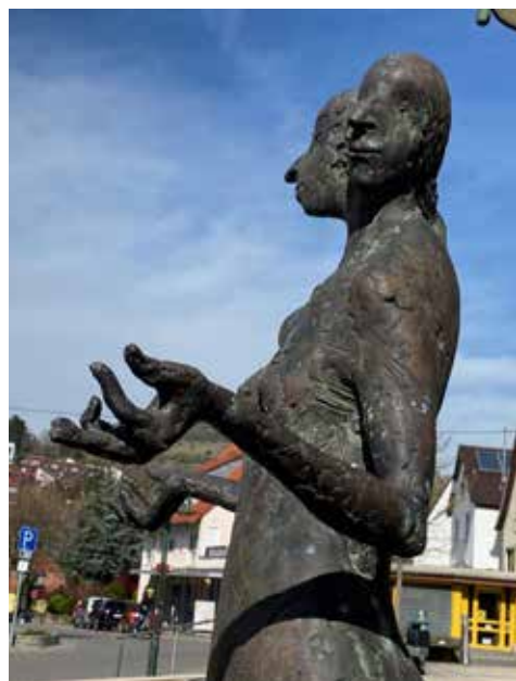
Die Dame auf dem E Punkt