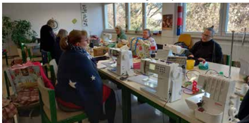
Nähtreff Januar 2024

Der nächste Nähtreff findet am Sonntag, 28. April ab 10.00 Uhr statt