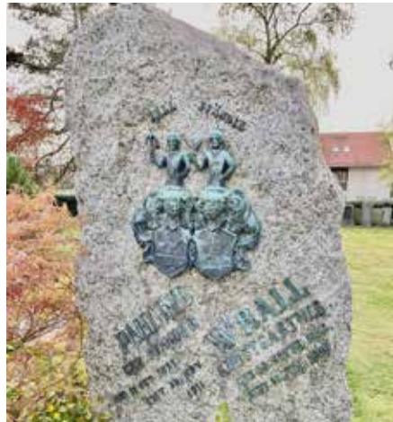
Der Grabstein von Wilhelm Rall

Sein Einsatz für die Natur und Heimat ist mit der Geschichte der Ortsgruppe des Schwäbischen Albvereins stark verbunden.