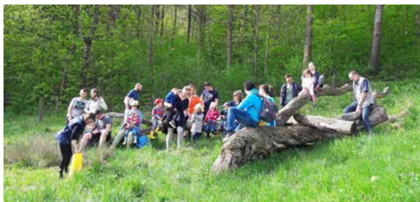
Der Minigottesdienst in Dettingen

Bei bestem Wetter haben wir das verlorene Schaf gesucht, wie der gute Hirte in der Bibelgeschichte. Wir suchten im Stall, im Heulager, im Gebüsch, auf dem Berg. Nirgendwo war es zu sehen. Und wir wollten es doch unbedingt finden, dieses eine, das fehlte! Juhu, schließlich und endlich hatten wir das Spieleschaf entdeckt. Im Wasserloch. Da konnte es aus eigener Kraft nicht mehr heraus. Wenn sich ein Menschenkind von Gott entfernt, dann möchte er es auch unbedingt wiederfinden. Auch er freut sich, wenn er es wiederhat! Im Ziegenstall haben wir dann noch die kleinen Lämmer besucht, um nachzuzählen, ob alle da sind. Ob sich alle 11 im Stall oder Außenbereich tummeln. Drei waren im Stall zu finden und acht im Außenbereich. Alle da!