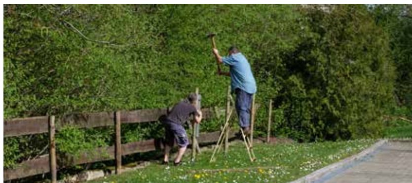
Voller Körpereinsatz beim Setzen der neuen Zaunpfosten

Ansprechpartnerin für Fragen: Regine Gorgas, E-Mail: 12qm@eki-eningen.de - Veranstalter: EKI - Eninger Kultur-Initiative e.V. Die Fotofreunde Eningen werden auf der Veranstaltung fotografieren. Wer nicht fotografiert werden möchte, soll sich bitte bei uns melden.