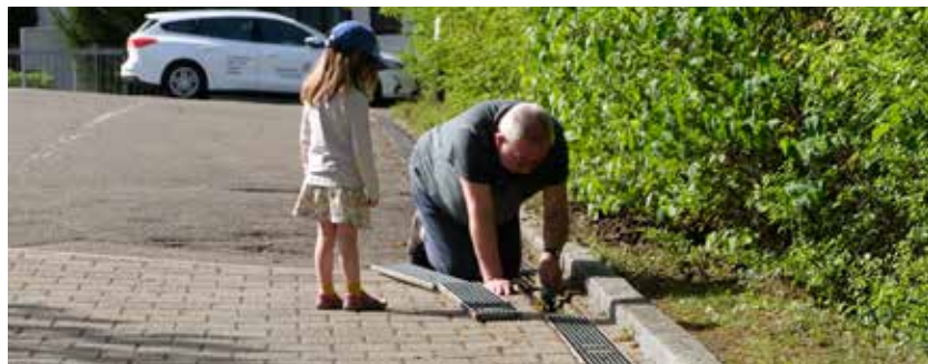
Säubern der Ablaufrinnen unter strenger Beobachtung