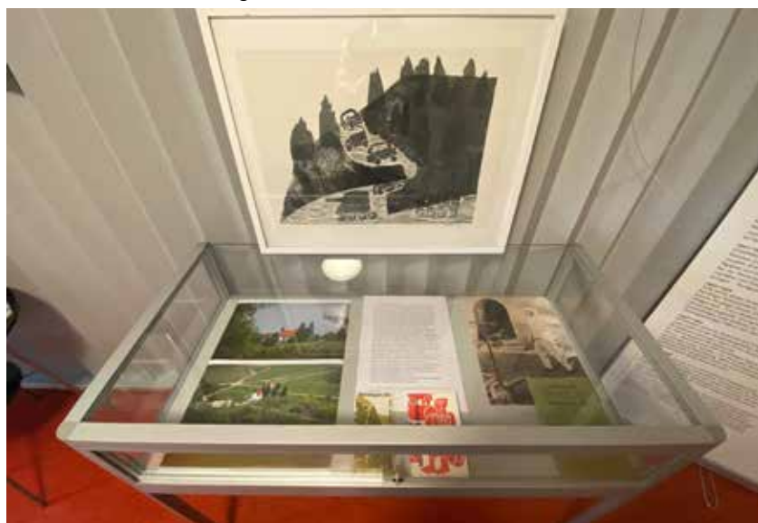
Die Vitrine zum Biosphärengebiet

Diese Verbundenheit beschreibt er so: „Sicher ist der sanfte Schwung der Hügel rundum in meinen Holzschnitten wieder zu finden, ist der melodisch bewegte Horizont manchmal Kontur der Menschen und Tiere, die ich schneide. Aber Landschaft, zur Heimat geworden, ist viel mehr“