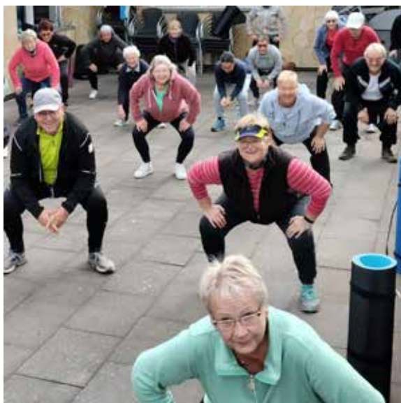
Rehasport macht Spaß und hält fit!

Anmeldung und weitere Infos unter 07121 55 08 18