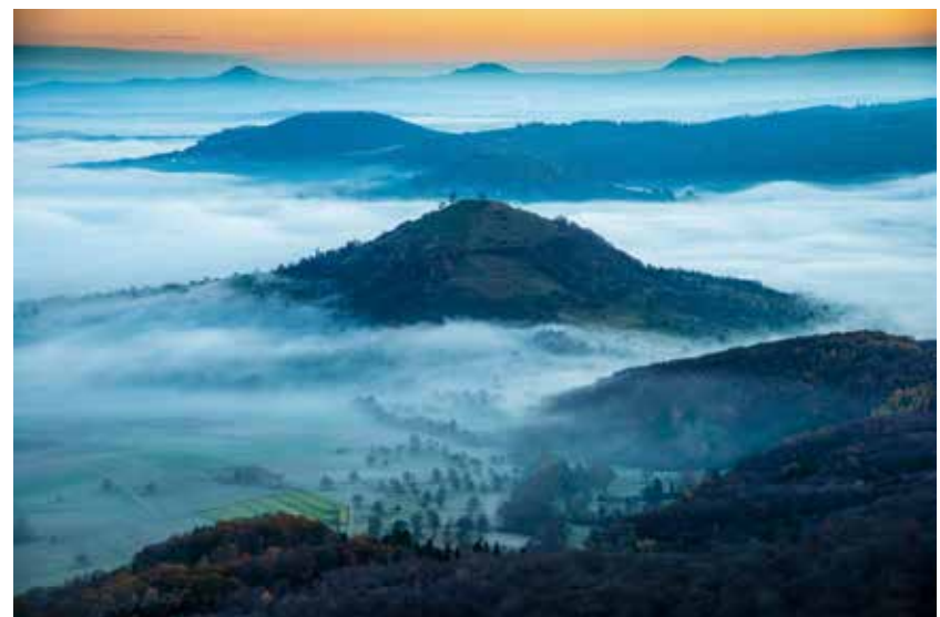
Limburg und die Kaiserberge

Eine Auswahl der besten Bilder aus ihrem Fotoprojekt „Wilde Alb“ haben sie in einer Multivisionsschau zusammengestellt. Im November 2019 offiziell vorgestellt, wird sie am 23. Februar um 19 Uhr in der Aula der Achalmschule Eningen nochmals gezeigt und von den beiden Projektleitern live kommentiert. Weitere Informationen auf unserer Homepage: www.fotofreunde-eningen.de ; Informationen zum Projekt „Wilde Alb“ und eine Bildergalerie auf der Seite wildealb.de . Mit Bildern aus dem Projekt wollen wir Sie auf diesen Abend einstimmen.