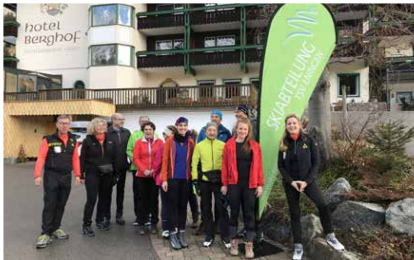
Die Langlaufgruppe der Skiabteilung im Tannheimer Tal