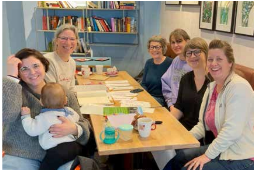
Inhaltlicher Austausch bei der GAL.