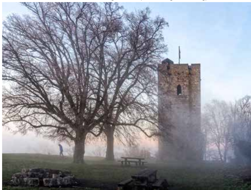
Auf der Achalm