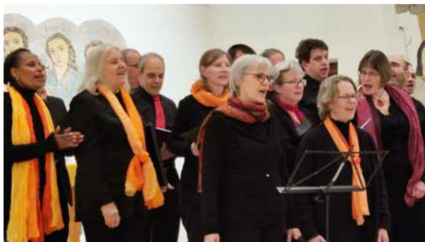
Vielen Dank an den Reutlinger Gospelchor samt Band für das mitreißende Konzert am vergangenen Sonntag in der gut besuchten Andreaskirche.