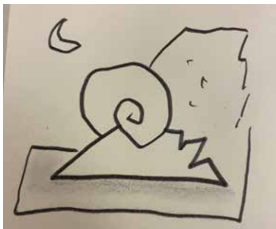
Zeichnung von Gudrun Krüger

Übrigens - es gibt noch die DVD über das Krüger Jahr von Prof. Dannemann beim Kulturamt und bei der Buchhandlung Litera im Angebot.