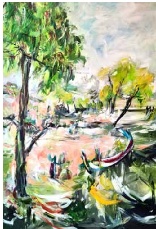
Karl Striebel: "gestrandet", Acryl auf Leinwand

Fünzig Prozent des Verkaufserlöses soll dem Paul-Jauch-Freundeskreis zugute kommen, der sich seit Jahrzehnten um das Erbe des Bleistiftzeichners kümmert und im Moment gemeinsam mit der Gemeindeverwaltung um den Erhalt des sanierungsbedürftigen Wohn- und Museumshauses kämpft. Unwetter und die dadurch ausgelösten Bodenbewegungen haben dazu geführt, dass das Gebäude im Moment für Besucher geschlossen bleiben muss. Sehr zum Bedauern von Kunstliebhabern der Region müssen daher auch die beliebten Ausstellungen zeitgenössischer und regionaler Künstler bis auf Weiteres ausfallen. Ein Trauerspiel in der eh sehr dürrtigen Landschaft von Ausstellungsräumlichkeiten. Striebels Ausstellung und seine Arbeiten aber ein farbenfroher Lichtblick! Bei Fragen und Interesse melden Sie sich gerne auf dem Eninger Kulturamt unter 07121-8921250 oder unter ramona.mathes@eningen.de