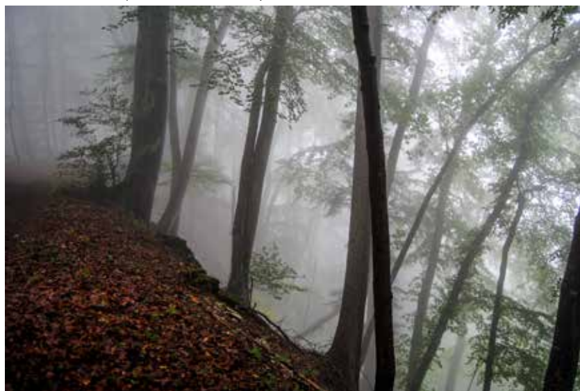
Wald bei Albstadt-Pfeffingen