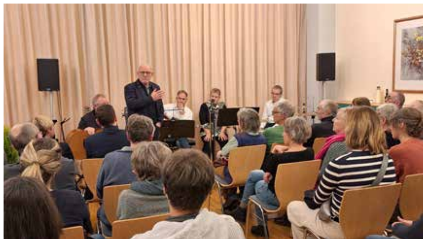
Verkehrsminister Winfried Hermann beim Neujahrsempfang der GAL, 18.01.2024.

Der Neujahrsempfang der GAL in Eningen war eine rundum gelungene Veranstaltung, die nicht nur wichtige Impulse für die Zukunft der Mobilität in Eningen setzte, sondern den Gästen auch eine unterhaltsame und informative Zeit bescherte. Die GAL dankt allen Teilnehmenden und freut sich auf ein aktives Miteinander und spannende Projekte im neuen Jahr.