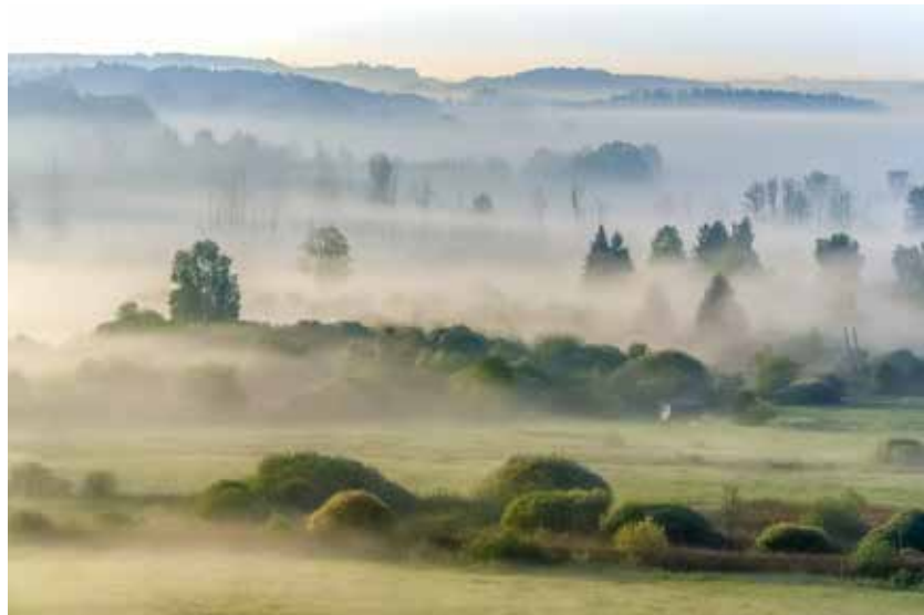
Blick vom Bannwaldturm im Pfrunger Ried

Unsere drei Bilder sind in besserer Qualität auf unserer Homepage zu sehen: www.fotofreunde-eningen.de/bilder-des-monats . Auch auf Instagram veröffentlichen wir regelmäßig Fotos: @fotofreunde.eningen. Unser Programm für 2024 können interessierte Fotografinnen und Fotografen auf der Homepage in der Rubrik „Mitmachen“ herunterladen. Seit Januar treffen wir uns in den Räumen der Andreaskirche Eningen.