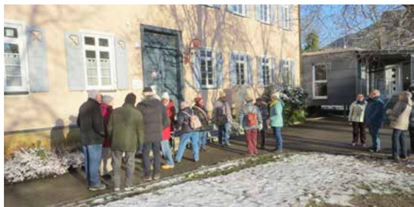
Glühwein-Stop beim Spital

Nach dem gemütlichen Beisammensein verabschiedete man sich bis zur nächsten Veranstaltung.